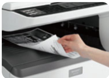
Impression et copie recto-verso