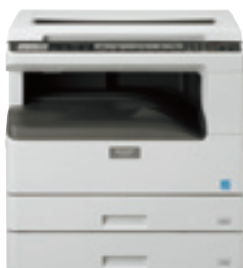
Système standard Couverture de protection