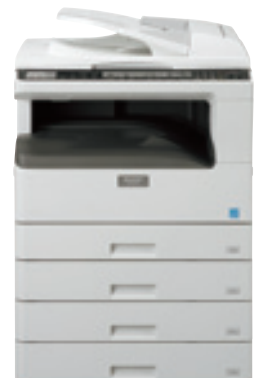
Système standard Chargeur de documents 4 x 250 feuilles