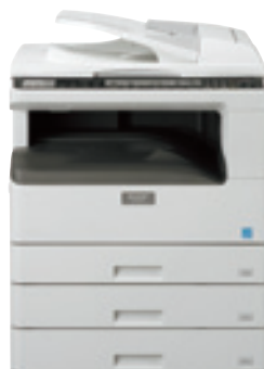
Système standard Chargeur de documents 3 x 250 feuilles