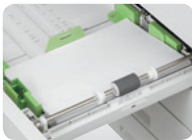
Rouleau de séparation